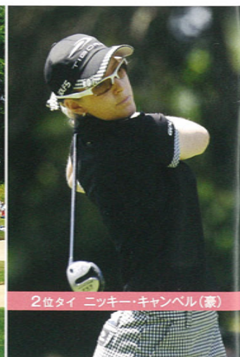
2位タイ ニッキー・キャンベル(豪)